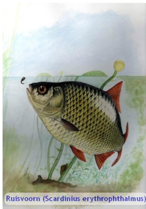
Ruisvoorn ( Scardinius erythrophthalmus )

Deze visgemeenschap wordt voor een groot deel gevormd door vissoorten die kenmerkend zijn voor helder, plantenrijk en zuurstofhoudend water. Deze zgn. limnofiele vissoorten als Snoek, Ruisvoorn, Zeelt, Kroeskarper, Vetje, Bittervoorn en Grote en Kleine modderkruiper vinden hun optimale ontwikkelingsmogelijkheden in de Ruisvoorn-Snoekvisgemeenschap en de Snoek-Blankvoorn-visgemeenschap (van der Spiegel, 1992; Zoetemeijer & Lucas, 2001; zie voor een overzicht van viswatertypen bijlage 1 ). Deze visgemeenschappen garanderen ook het voorkomen van de meeste roofvis waardoor de bezettingsdichtheid van de totale visstand laag kan worden gehouden als gevolg van predatie en het water helder en plantenrijk blijft. Sturend voor de kenmerken van deze visgemeenschappen zijn vooral omgevingsfactoren zoals de eutrofiëgraad van het water, het doorzicht en de hoeveelheid waterplanten. Daarnaast spelen hierbij